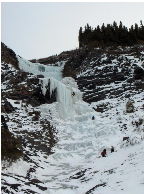
Les Cavaliers du vent.