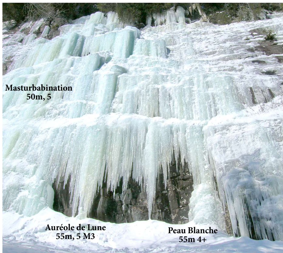
Masturbabination 50m, 5