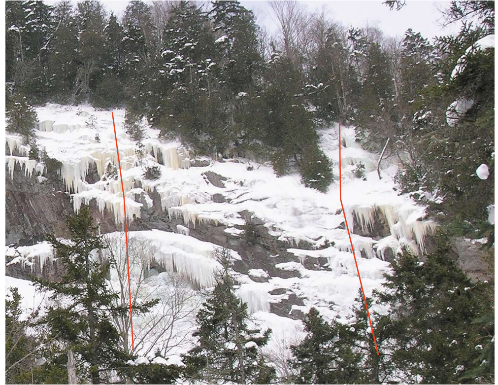
Les Fils de Caleb