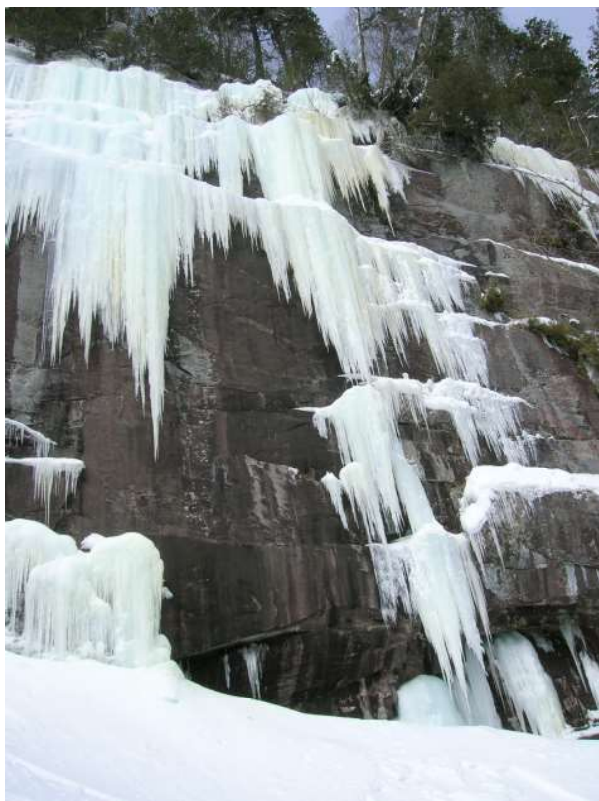
Airproofing , mars 2009