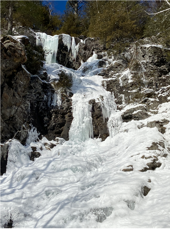
Le petit diable