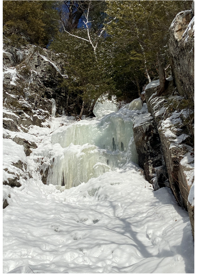
Le Couloir 1